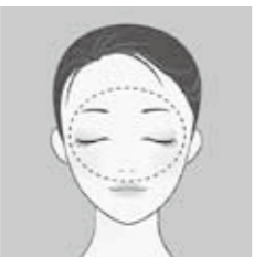
顔の中心に明るめの色を重ねて使用しましょう。

一日中透明感のあるお肌を保つには、ファンデーションの2色使いがオススメ。素肌の色に近いファンデーションを全体に塗ってから、Tゾーンとほほの部分にいつもより2段階明るい色を重ねて使用していきましょう。印象がぐんと明るくなり、時間が経ってもくすみが目立たなくなりますが、化粧直しはティッシュなどで皮脂や汗を押さえ、メイクがヨレてしまっている部分をいったん拭き取ってから行うのがポイントです。(きれいの術③ではコンシーラーの活用についてご紹介します)