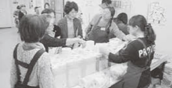
トイレットペーパーの違いをさわって実感