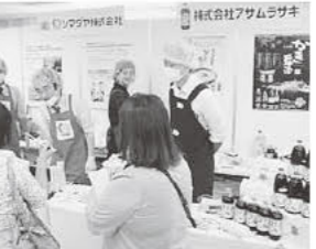
「かき醤油だしの讃岐うどん」

活動委員さんも参加し、核兵器禁止条約署名の呼びかけを行い、146筆あつまりました