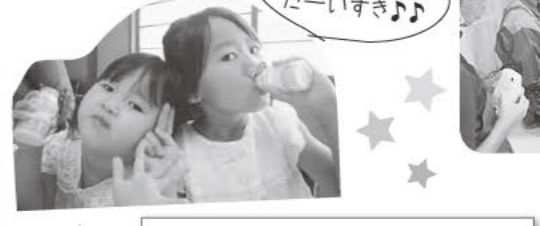
「わくわくうなぎつかみ」 その場で写真を撮ってプレゼント!!

料理がワンパターンになりがちなので、またこのような試食会に参加し、食材の使い方バリエーションを学びたいです。 (参加された組合員さん)