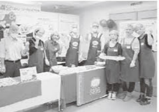
「ホタテ&ジェノベーゼソース」

★春雪さぶる+MCC食品★ ★川口水産+全農パルライス★ ★シマダヤ+アサムラサキ★