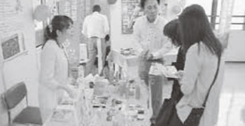
「この乳液良さそうね」