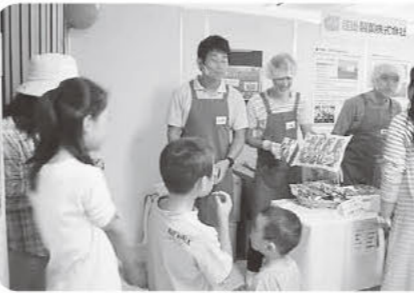
配送担当も一緒になって組合員さんと商品の話で盛り上がりました☆