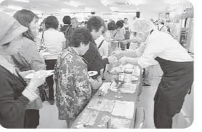
お正月商品も一足先に試食☆