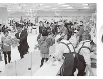
広い会場で、ゆったり ブースを回ることができました!!