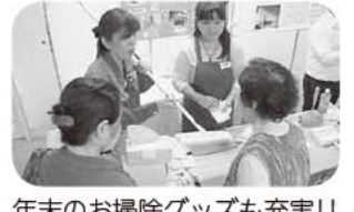
年末のお掃除グッズも充実!!