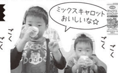
ミックスキャロット おいしいな☆