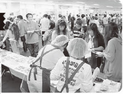
会場はとっつもとにぎやか☆

参加して良かったです。生産者や取引先の方々の熱意を直に感じることができました!! (参加された組合員さん)