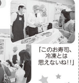
「このお寿司、 冷凍とは思えないね!!」

おいしくてぜひ頼もうと思えるものがたくさんありました。帰ったらさっそくカタログをチェックしたいです♪ (参加された組合員さん)