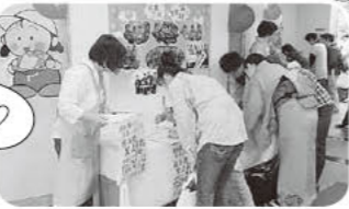
「核兵器廃絶のための署名」 活動も各会場で行われました

参加して良かったです。生産者や取引先の方々の熱意を直に感じることができました!! (参加された組合員さん)