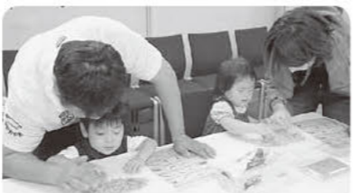
体験コーナー「小魚モンスターを探せ!!」 パパやママも子どもに負けず真剣です