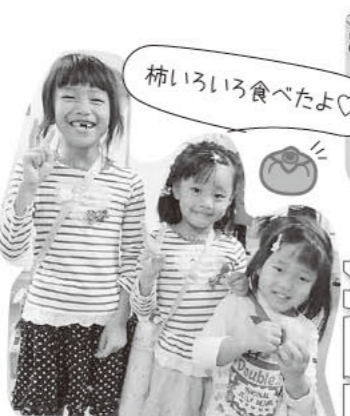
柿いろいろ食べたよ♡