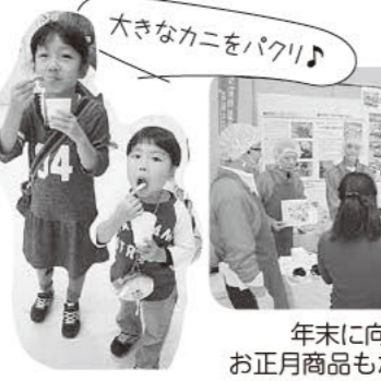
大きなカニをパクリ♪