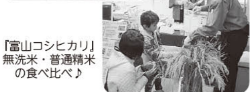
「富山コシヒカリ」 無洗米・普通精米の食べ比べ♪

<参加取引先様(略称・順不同)> コーライ食品・北海道漁連・マルイ農協・全農パルライス・アマタケ・ニッキーフーズ・ニチレイフーズ・ふくれん・大山乳業・全農ミートフーズ・ニチモウフーズ・玉清・カモ井・JF全漁連