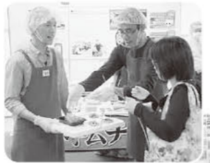
鶴見支所開発 「キムチのきもち」も試食!!

試食で食べた「ぱくぱくさんまのチーズ乗せ」は魚嫌いなお父さんのビールにあてに出せそうで、見た目も豪華☆ (参加された組合員さん)