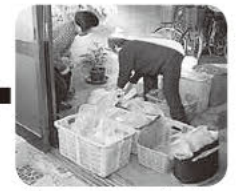
ガレージに個人ごとのかごを並べ、荷分けのスタンバイもばっちり☆