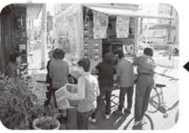
トラックが到着!! みんなで協力して商品を運びます