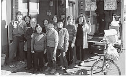
集合写真もにぎやか!! 「牛乳やお豆腐、お米や食パンなど毎日使うものは生協で買ってます☆」