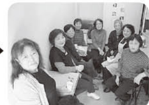
「11時ごろまでしゃべってるよー!」 荷分けの後はいつも組合員さんのお家でお茶タイム