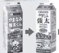
やまなみ強太くん 1997年～ やまなみ強太 1999年～