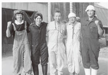
酪農家のみなさん