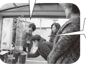
どなんん? どなんん?