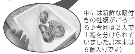
中には新鮮な殻付きの牡蠣がごろごろ♪今回は2人で1箱を分けられていました。(本来は6個入りです)

週1回決まった曜日の決まった時間に「班（グループ）」で集まって、和気あいあいと荷分けされている組合員さんが多くおられます。今回は、大阪市住吉区の閑静な住宅街にある、木曜日午前中の班におじゃましてお話を伺いました。