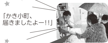
「かき小町、届きましたよー!!」

他の人の買ってる商品を見たり感想を聞いたりすると、次に私も買ってみたいよ〜ってなるよね♡