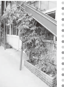
巨峰の木は種をまいてから約10年以上にも！