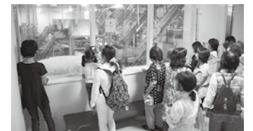
まきの地域活動委員会 「サラダコスモ もやし工場見学」 (7月23日)