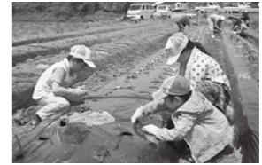
紀ノ川農協「親子農作業 連続体験ツアー (定植)」