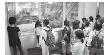
まきの地域活動委員会 「サラダコスモ もやし工場見学」 (7月23日)