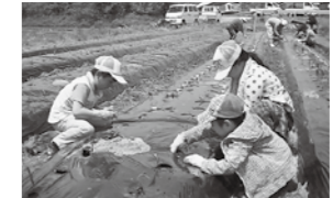
紀ノ川農協「親子農作業 連続体験ツアー (定植)」