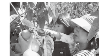
柿収穫体験ツアー (11月13日)