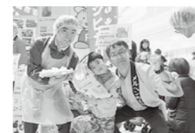
JAいなばの生産者さんと参加された組合員のお子さん、配達職員 (1月21日)