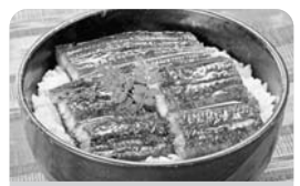
広東うなぎ蒲焼 冷蔵 4月3回 130g(1尾) 780円

原料のうなぎは、日本で養殖されているのと同じジャポニカ種。加工場では、日本人の指導で泥抜きや焼き工程を日本向けにした、味も良くやわらかい蒲焼です。焼き具合・蒸しなどの加工チェックや安全性についての検査などに合格したものを輸入します。