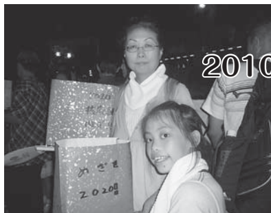
元安川でのとらう流し