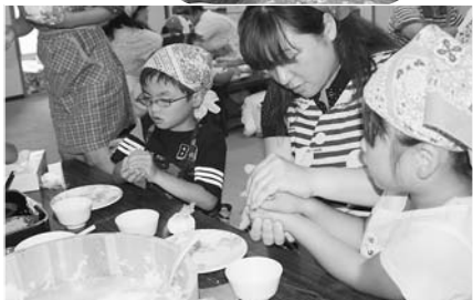
おにぎりの具は定番のおかか、梅干し、明太子、鮭フレーク、昆布、ツナマヨ、ミートボールも。

大きい小さいの、三角、丸、俵型、ハート形、具を中心に入れるの...のせるの...。楽しいおにぎりがたくさん並びました。おにぎり、味噌汁。シンプルなメニューを選んだのは理由があります。「コン」でも簡単に手に入るけれど、手作りは安心だし、人の手で作ったものはおいしい」とクッキングのメニ