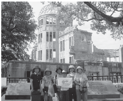
原爆ドームの前で、ヒロシマ平和の語り部の方と(左端)

パルコープでは、被ばく体験を風化させず次世代へ伝えるために毎年「ピースツアー」を行なっています。原爆が投下されたのは世界でも広島と長崎の2都市だけです。親子や友人でその地を訪ね、見て、聴いて、知る「ピースツアー」。今回はヒロシマツア一の報告です。