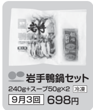
岩手鴨鍋セット 240g+スー+フ50g×2 [冷凍] 9月3回 698円