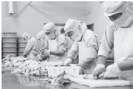
田野畑工場での解体作業は手で行います

組員さんから「お鍋のシーズンには欠かせない!」家族みんなで復活を待ってます」という声が多く聞かれる「岩手鴨鍋セット」が9月3日からスタートします。産地の岩手県へ、当時の様子や復興にける想いをうかがいに田野畑村と大船渡市の工場を訪問しました。