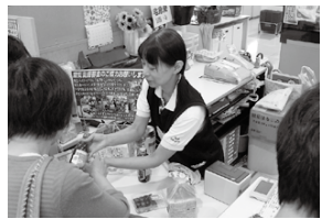
つるみ店のサービスカウンターでQRシールが発行されます。

グループ「さざ波」 ●2008年に結成、登録メンバーは16人。 ●障がいのあるなしに関わらず、同じ情報を提供できるようにすることを目的としています。