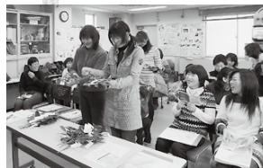
「やってみると難しいものですね」玉串奉天(神式の時)

「お葬式に行ったことない方、いますか?」から始まった、生協のお葬式「はるむ」の学習会。いつ起こるか分からないのに、葬祭のことはなかなか準備していないものです。