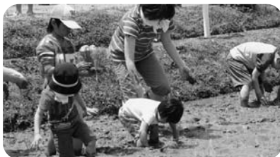
(写真はグリーン近江)