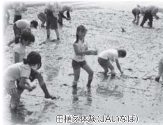
田植え体験(JAいなば)

産直商品を生みだしている“産直産地”をご存知ですか? パルコブの組合員が願う“より良い商品”を作り、長年にわたり交流を重ねて互いに理解しあって信頼関係を築いてきた、大切なパートナーです。 今年も、パルコブでは組合員さんと生産者との交流を大切に、産地が見える心の通ったツアーにとりくみます。