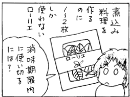
注:ロ-川エロ-レルは肉じゃが