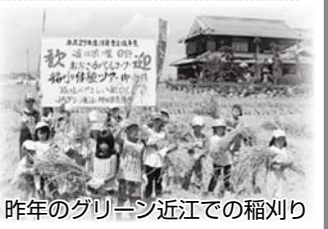
昨年のグリーン近江での稲刈り

※申し込み多数の場合は抽選し、結果ははがきでお知らせします。 ※宿泊は相部屋になることもあります。ご了承ください。 ※応募で得た個人情報はツアーの連絡、産地交流に係る企画案内以外には使用しません。