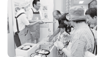
大根、よ〜味しみてるわ。夕食サポート1回試してみよかな。(夕食サポートブース)