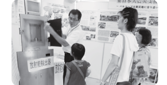
放射能測定器の実物大オブジェで放射能検査の説明を。熱心に聞く組合員さん(商品検査室ブース)

9月1日(土)「阿倍野組合員集会所」、9月8日(土)「枚方組合員集会所」の様子を裏表紙で紹介しています。