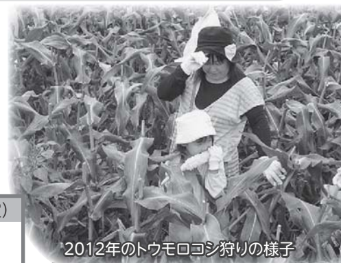
2012年のトウモロコシ狩りの様子

産直商品を生みだしている“産直産地”をご存知ですか？ パルコプの組合員さんが願う“より良い商品”を作り、長年にわたり交流を重ねて互いに理解しあって信頼関係を築いてきた、大切なパートナーです。今年も、パルコプでは組合員さんと生産者との交流を大切に、産地が見える心の通ったツアーにとりくみます。