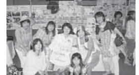
パルコープの展示ブース。今年7月のピースリレーなど、平和についての組合員活動の報告をしました

くらしの環境食 組合員活動のコーナー 広島で開催された日生協主催の「ピースアクション」に今年もパルコープから組合員活動メンバー10名が参加しました。(8月5日)