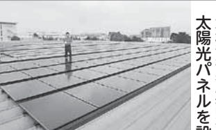
太陽光パネルを設置しました

主催: 地球環境と大気汚染を考える 全国市民会議(CASA) ※パルコープも加盟しているNPOです