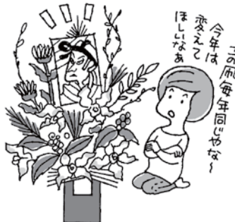
切り花Cの完成イメージです。花器はついていません。凧の大きさやお花の内容は多少異なります。

毎年この切り花を購入していますが、花の間に飾るための凧が毎年同じで残念です。絵を変えたりする工夫をしてほしい。それも楽しみの一つなんですよ。